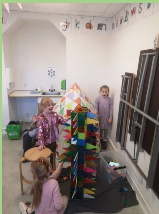
Leg, samvær og læring

I slutningen af Forårs SFO'en udvides samarbejdet mellem jer forældre og den omgivende skole, særligt samarbejdet med de kommende børnehaveklasseledere. I slutningen af juni laver vi to gode klassefællesskaber, og I orienteres om, hvilken klasse jeres barn skal gå i. Det er vigtigt for os at pointere, at vi vægter - og dyrker - et godt og udviklende årgangssamarbejde på tværs af de kommende klasser, og at der bruges meget tid på samarbejde på tværs af årgangene for at sikre, at alle børn har gode relationer og bliver udfordret optimalt rent læringsmæssigt.