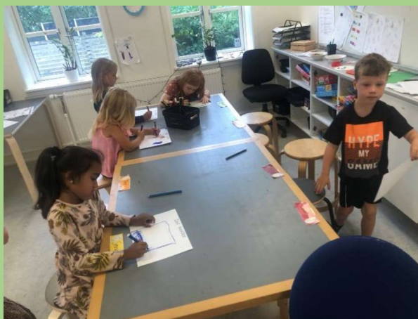
Fordybelse og læring