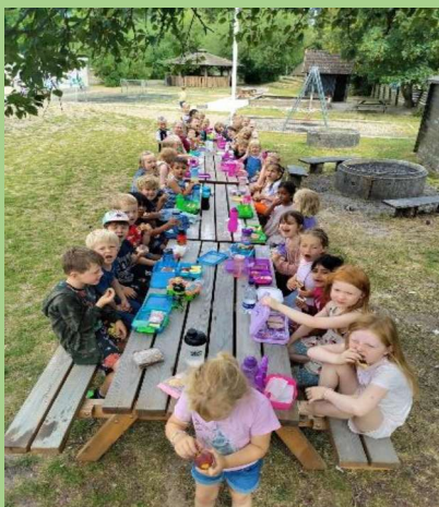
Fællessamling og hygge

Dit barn kommer til at møde mange nye børn i Forårs SFO. Vi har erfaret, at forældre ofte gør sig unødvendige bekymringer om deres barns legerelationer i den første tid i Forårs SFO. Vi vil understrege, at vi hjælper og støtter jeres barn i at danne gode relationer og i at indgå i nye børnefællesskaber. Fra start inddrages børnene i to grupper: Flammerne og Fiduserne. Børnene arbejder både i disse grupper, men også på tværs i mindre grupper.